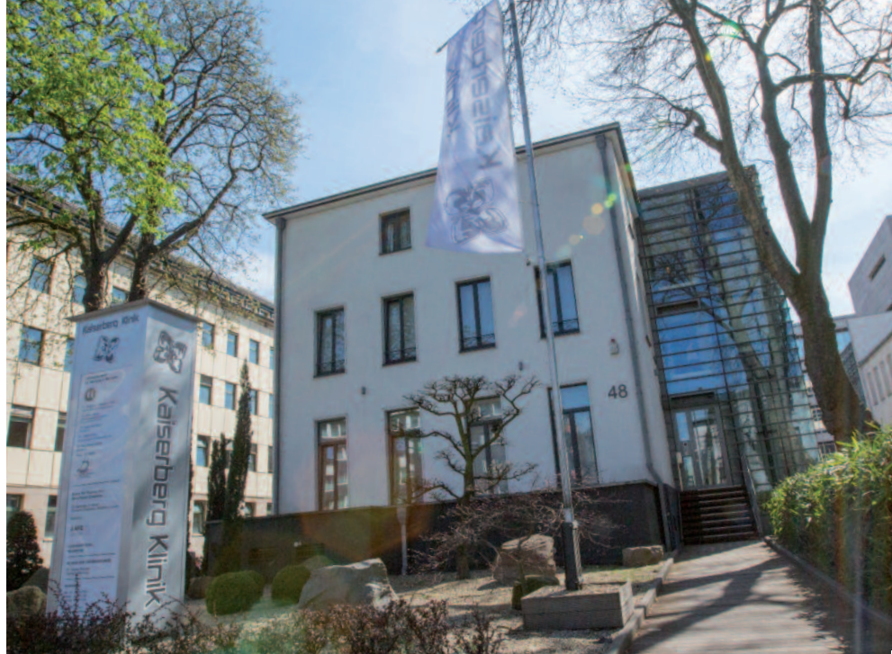
Das Brånemark Osseointegration Center befindet sich in den Räumlichkeiten der Kaiserberg Klinik in Duisburg.